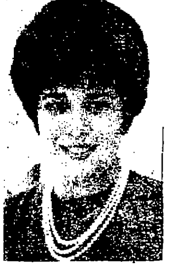
عمان - قامت سمو الاميرة بسمة المنظمة رئيسة الشرف لجمعية اصحاب المستشفيات العسكرية بزيارة المستشفى الرئيسي بعد ظهر امس برافقتها عدد من سيدات الجمعية . وقد تلقته سموها خلال هذه الزيارة احدى الجرحى وتقدم اليهم بعض الهدايا بمناسبة الاعياد السعيدة .